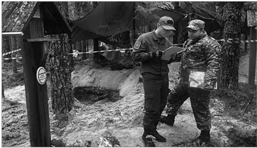
➤ Окончание. Начало на с. 1

трополог, заявленных в пресс-релизе археологов нет. Нет также финских историков и поисковиков, об участии которых говорилось на пресс-конференции РВИО в июне в РИА «Россия сегодня». По словам Осиева, «их не интересуют эти захоронения». 13 августа Санкт-Петербургский «Мемориал» составил Открытое письмо в Генеральную прокуратуру Российской Федерации, в котором дает оценку происходящему и просит провести проверку законности действий РВИО. Публикуем полный текст обращения: