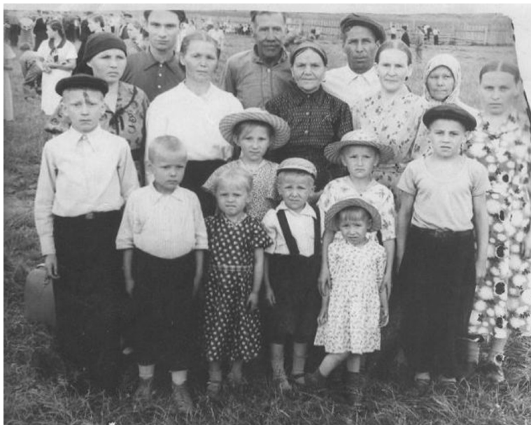
Анисимовцы на Дне песни. 1951 год