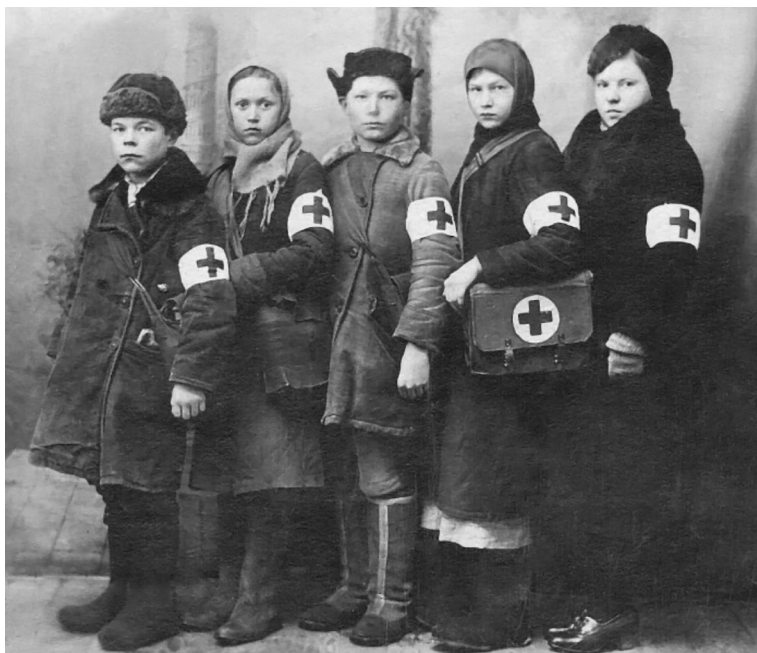
Учащиеся Григорьевской школы – волонтеры того времени