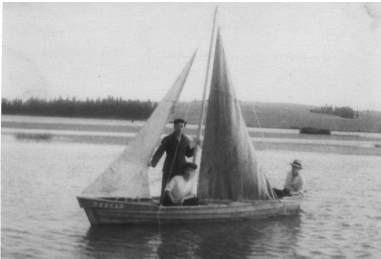
Лодка с парусом, сделанная руками военнопленных, на Григорьевском пруду

Памятник собою представляет православный крест около трёх метров высотой. В основании креста – квадрат размером 100х100 см из гранита, присыпанный гранитной крошкой. Рядом гранитная глыба с надписью «Здесь покоятся венгерские военнопленные – жертвы Второй мировой войны». Территория памятника обнесена железобетонными столбами белого цвета. Памятник находится в нескольких метрах от настоящего захоронения военнопленных, скончавшихся в госпитале, дислоцированном в Григорьевском.