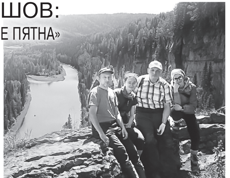
Члены экспедиции на берегу Усьвы.