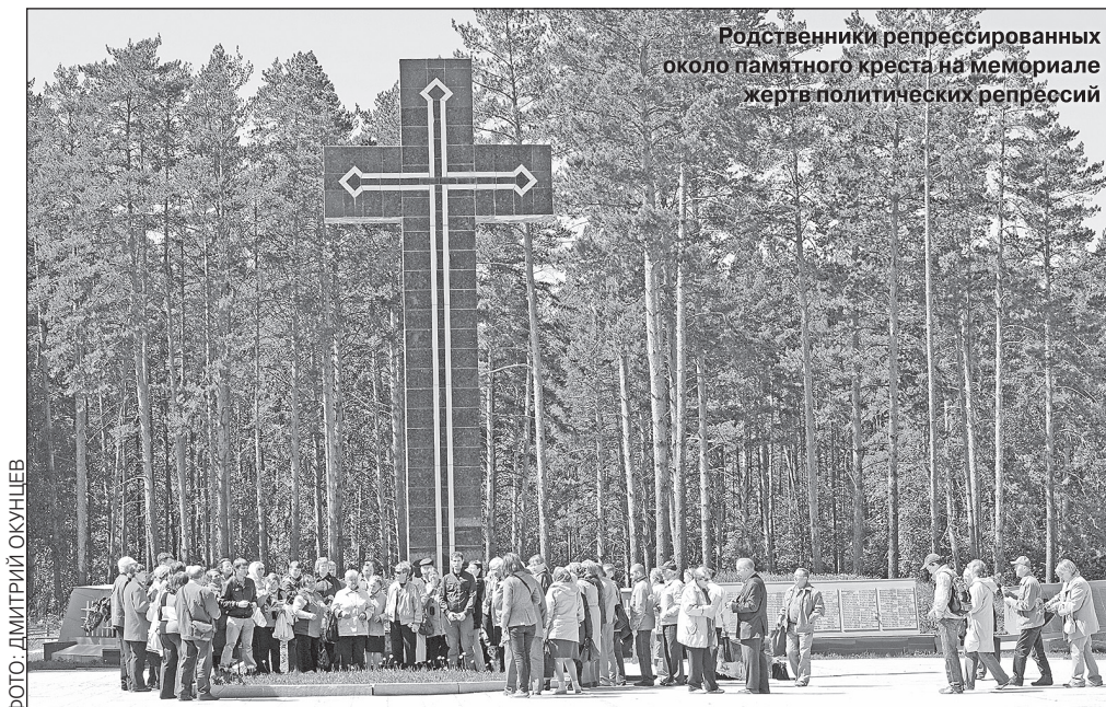
Родственники репрессированных около памятного креста на мемориале жертв политических репрессий

В 1990 году Свердловский горисполком принял решение признать это место «официальным кладбищем». В 1991 году прокуратура Свердловской области провела выборочную эксгумацию тел. Тогда нашли останки 31 человека, с отчетливыми пулевыми ранениями в голову, они были перезахоронены. В 1996 году здесь открыли первую очередь мемориала. А в 2017 году установили «Маски скорби» работы Эрнста Неизвестного.