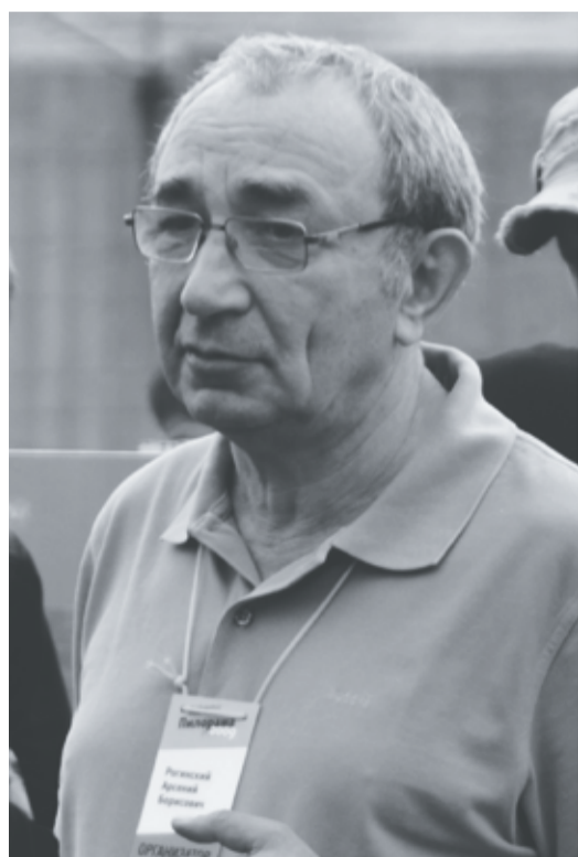
Арсений Рогинский на гражданском форуме «Пилорама» в 2009 году

«Да не сгинет «Мемориал!» — написал он мне одну из книжек ещё в середине 1990-х.