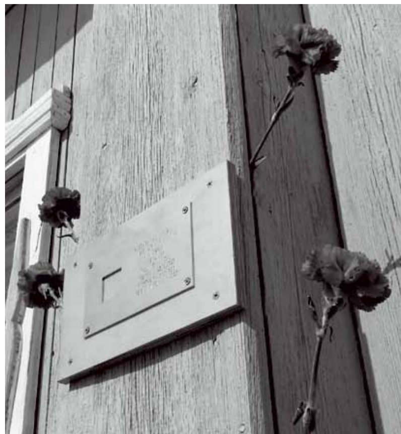
Такие мемориальные таблички напоминают будущим поколениям о трагической судьбе тысяч ни в чем не повинных людей