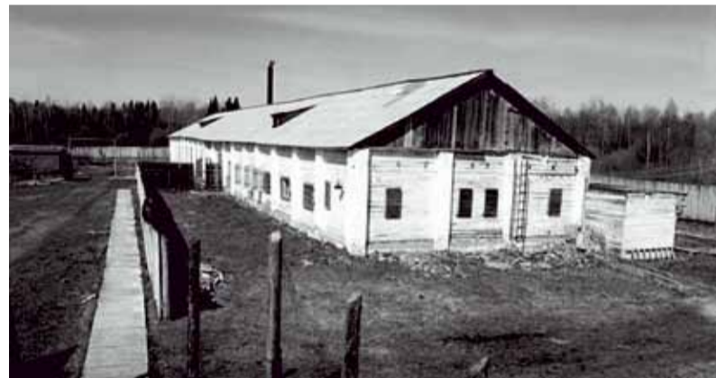
Барак особого режима колонии «Пермь-36» после реконструкции