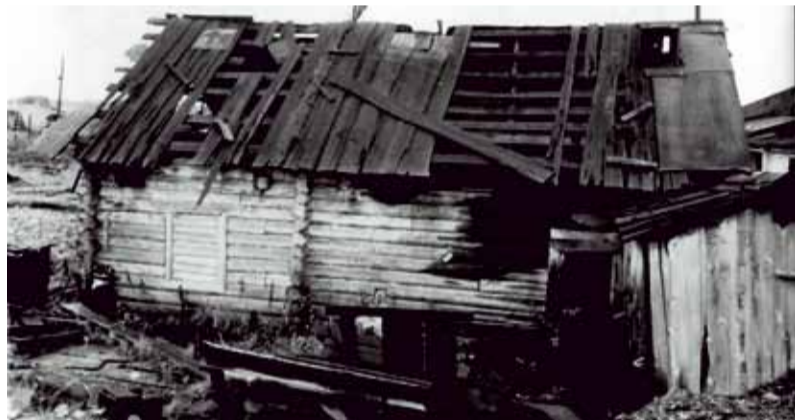
Лагерь в деревне Кучино до восстановления

Иногда приходится слышать: «Главное, что музей сохранён и работает. А ведь могли и уничтожить!» Мы так не считаем. Мы считаем, что справедливость по отношению к людям — важнее. «Мемориал» — правозащитная организация, деятельность которой направлена не только на то, чтобы бывшие репрессированные и их семьи получали положенные льготы, но и — в первую очередь — на то, чтобы репрессии никогда не повторились.