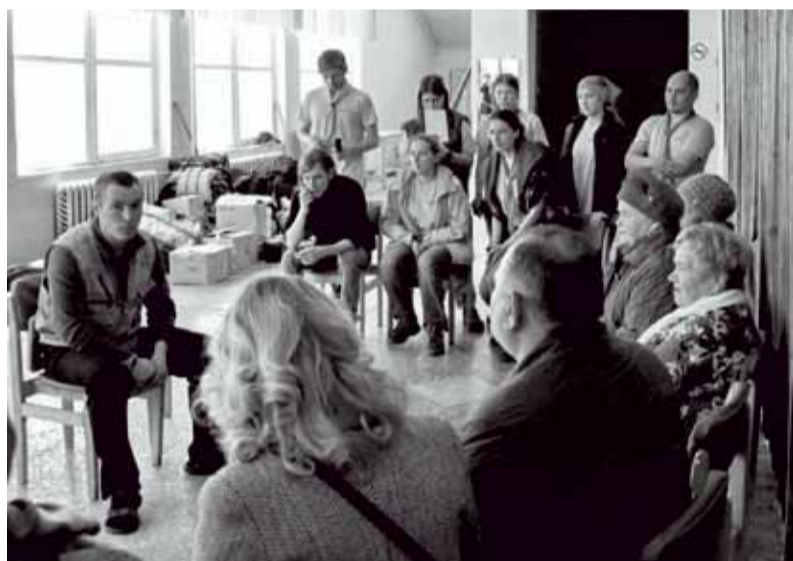
Встреча с жителями Тёплой горы

Тёплая гора — посёлок довольно крупный по северным меркам. Когда-то здесь кипела жизнь, добывали алмазы, жгли уголь, делали чугун. Теперь же, как и везде по северу края, — то-склиный, неуютный покой, попахивающий скорым забвением.