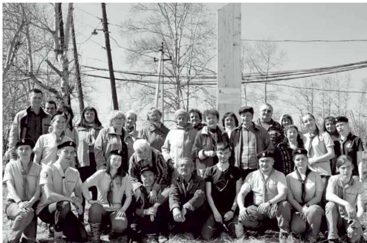
Открытие памятного знака в посёлке Тёплая гора

Перед тем как разойтись, жители Тёплой горы поблагодарили волонтеров и пообещали ухаживать за памятником. Установка и торжественное открытие мемориального знака памяти жертв политических репрессий стали завершением нашей миссии в Тёплой горе, но не концом