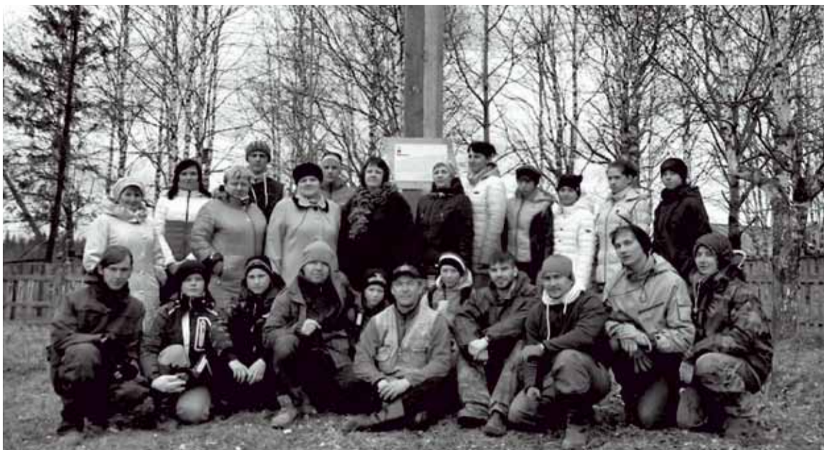
Открытие памятного знака в посёлке Вильва

Владимир Соколов Публикуется в сокращении. Полный текст — на сайте rteet.ru