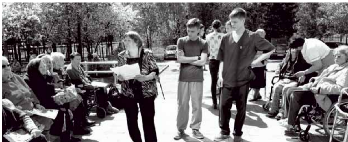
Пациенты геронтологического центра одобрительно относятся к «альтернативным» санитарам

Социально значимый проект «Право на альтернативу» реализуется Пермским краевым отделением общества «Мемориал» с февраля 2016 года благодаря победе на «президентском» конкурсе грантов. Мы оказываем правовую помощь юношам — призывникам, военнослужащим и альтернативнослужащим, а также ведём просветительскую работу по гуманизации призыва в Пермском крае.