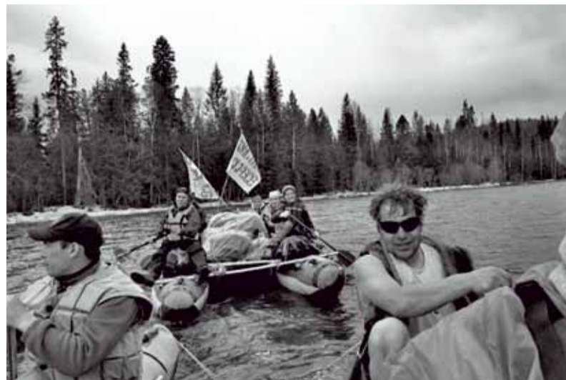
Сплыв на катамаранах по весенней Вильве

Следующий пункт по плану — посёлок Вильва. До него всего несколько километров, поэтому дошли быстро. Посёлок жи-