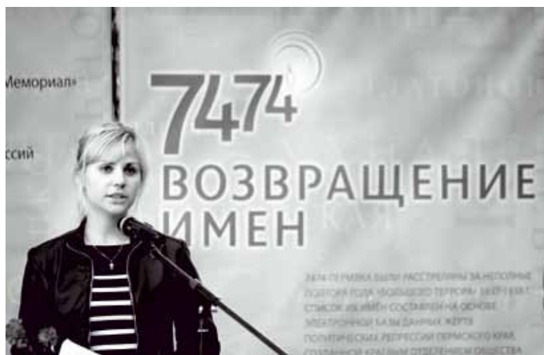
Гражданская акция «Возвращение имён» в Перми состоится в сквере Декабристов (перед зданием следственного изолятора) 30 июля с 17.00 до 19.00.

Правление Пермского краевого отделения Международного общества «Мемориал»