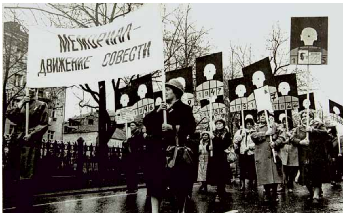
Первая демонстрация 1 мая 1989 г.

В середине 1980-х годов несколько журналистов и пермских историков поставили перед собой задачу собрать вместе недавних страдальцев — бывших репресси-