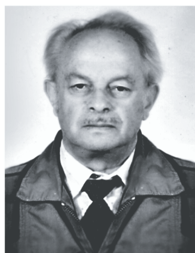
Ему уже за 70

Примерно в конце июня Зекцера вызвали к начальнику тюрьмы. Зачитали приговор ОСО (особого совещания при министре внутренних дел): три