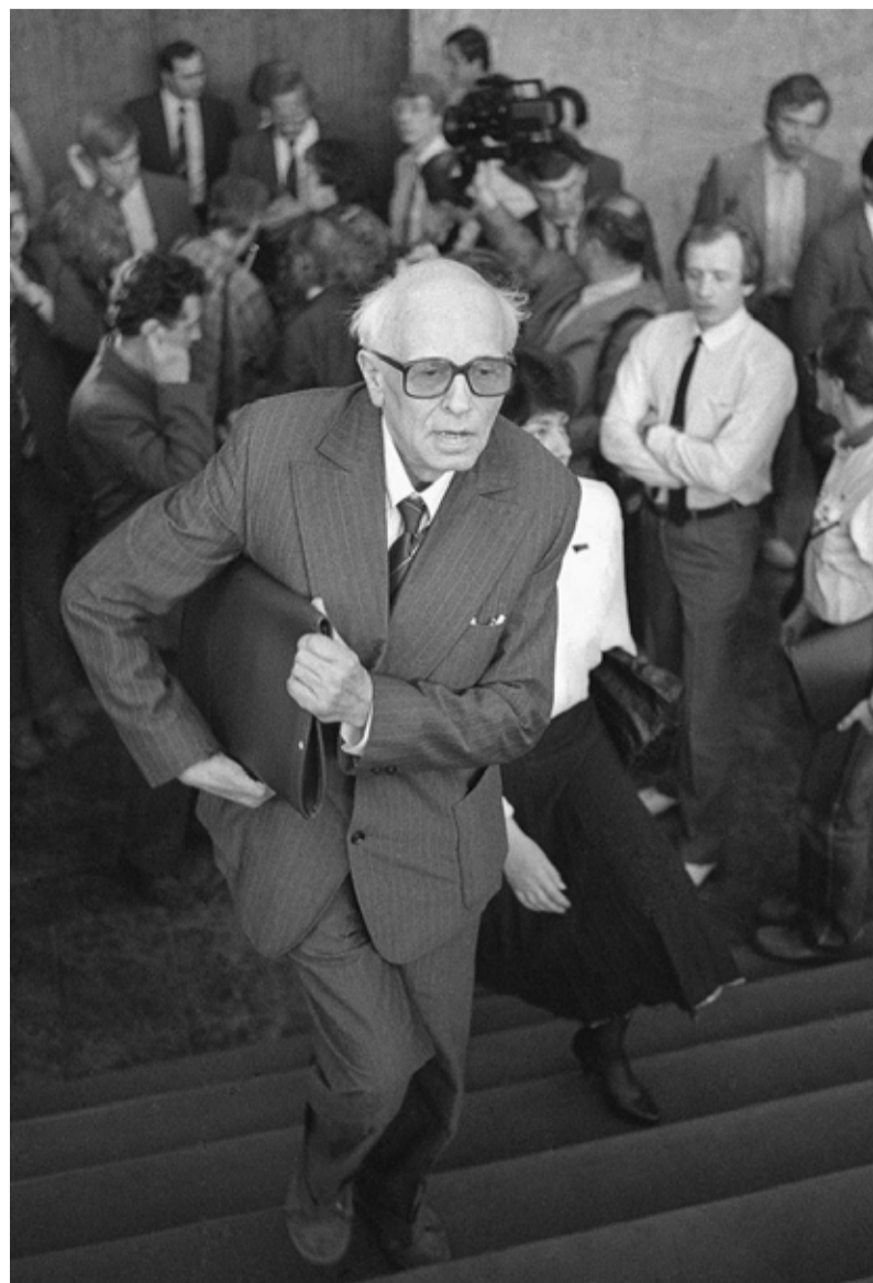
Андрей Сахаров на учредительной конференции «Мемориала»

Конечно же, большинство вопросов журналисты адресовали Сахарову. Его, например, спросили о задачах, которые ставит перед собой движение «Мемориал». Как всегда, Андрей Дмитриевич ответил кратко и внешне просто. Но эта формулировка — навсегда: «Мемориал» — это триединство задач. Первая — вернуть прошлое, вернуть историю народу. Второе — защитить тех, кто попал в сталинскую мясорубку, вернуть им утраченное достоинство, компенсировать матери-