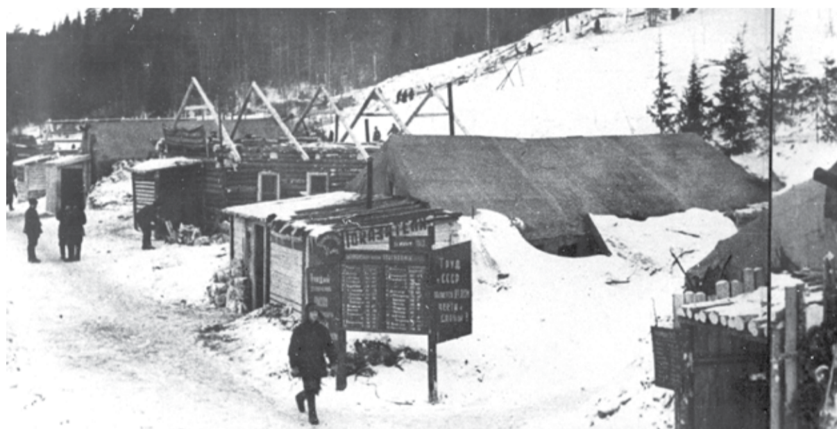
Основная зона Понышлага НКВД СССР. Чусовской район Молотовской области. Зима 1942 — 1943 годов