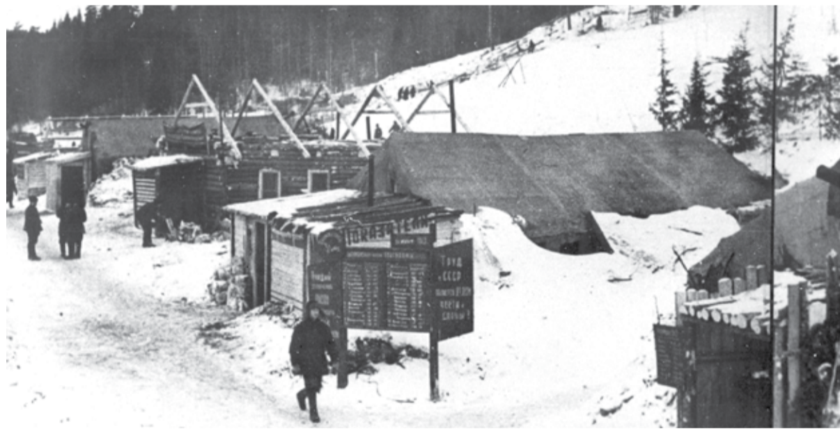
Основная зона Понышлага НКВД СССР. Чусовской район Молотовской области. Зима 1942 — 1943 годов