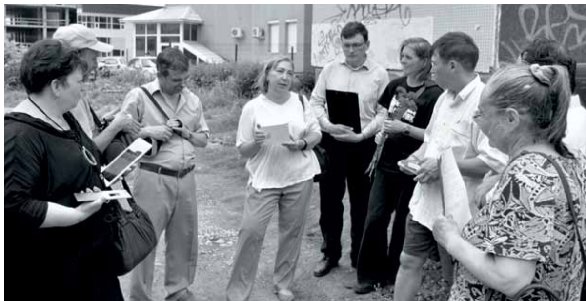
Церемония установки табличек «Последнего адреса» на доме №1 по улице Пушкина