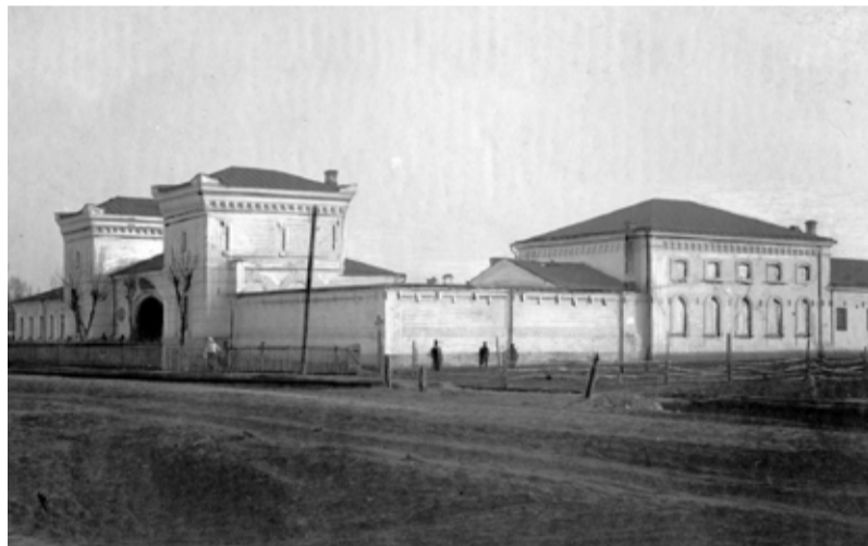
Пересыльный замок, тюрьма НКВД №1 в г. Перми. Ныне — здание Театра кукол. Снимок начала XX века