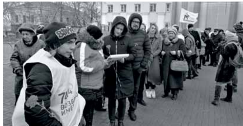
Акция «Возвращение имён» в Перми

В Перми акция состоялась уже в восьмой раз. Имена невинных жертв произносили на Соборной площади. С Камы дул сильнейший ветер, погода была неласковая... И всё же выстроилась длинная очередь тех, кто захотел присоединиться к акции. Впервые за все годы её проведения удалось