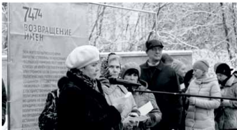
Акция «Возвращение имён» в Суксуне

Усьва, Гремячинск — эти посёлки Пермского края были одними из многих, куда тоталитарная сталинская система отправляла тысячи заключённых, спецпоселенцев, трудармейцев в качестве бесплатной рабочей силы. Представители 41 национальности участвовали в строительстве Гремячинска. Суровые зимы, недоодевание, непосильный труд свели в могилу не одну тысячу из этих людей. К Дню памяти жертв политических репрессий открылась выставка в городской библиотеке, где представлены скорбные списки, составленные на основании записей рабочих и служащих управления новых шахт