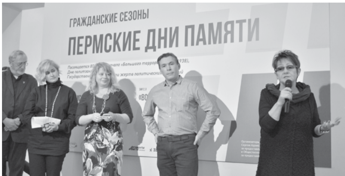
Гражданские сезоны «Пермские дни памяти»