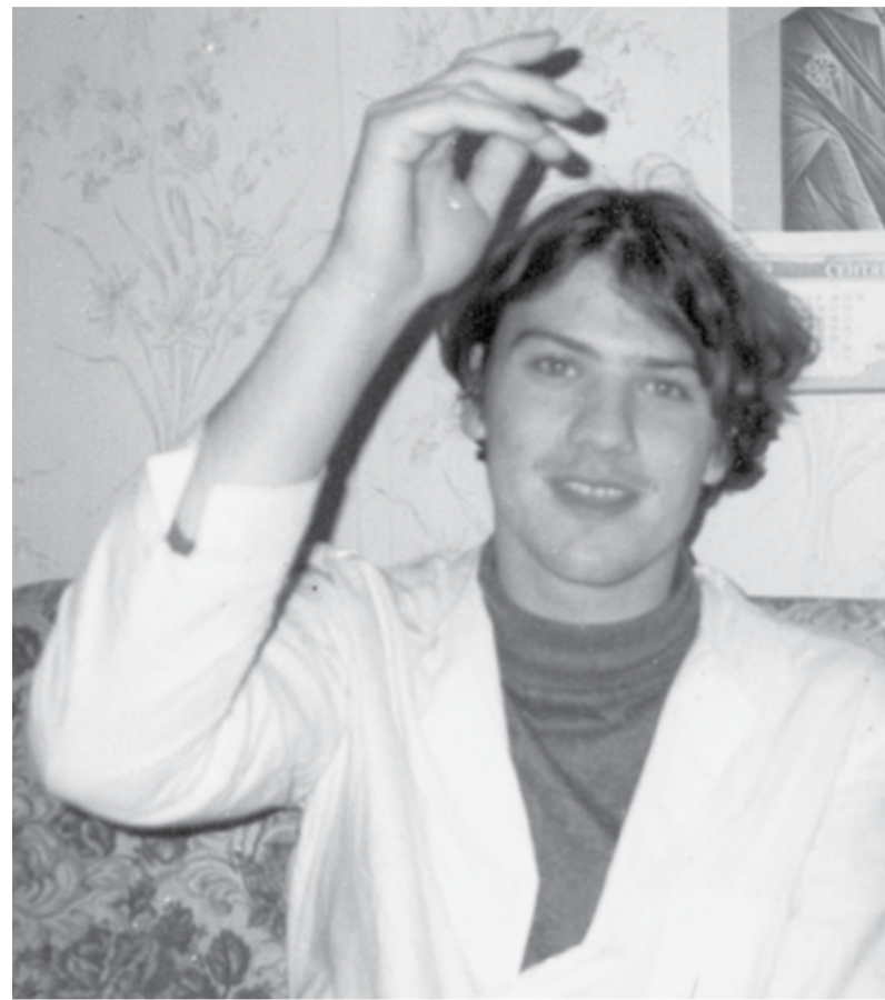
Тим Бозе, 1997 год

ственные помещения. Прислушал экскурсовода, который бесстрастно произнёс заученный текст. Понял, поче-