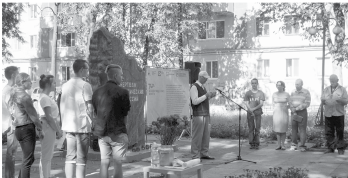
«Возвращение имён» в Краснокамске