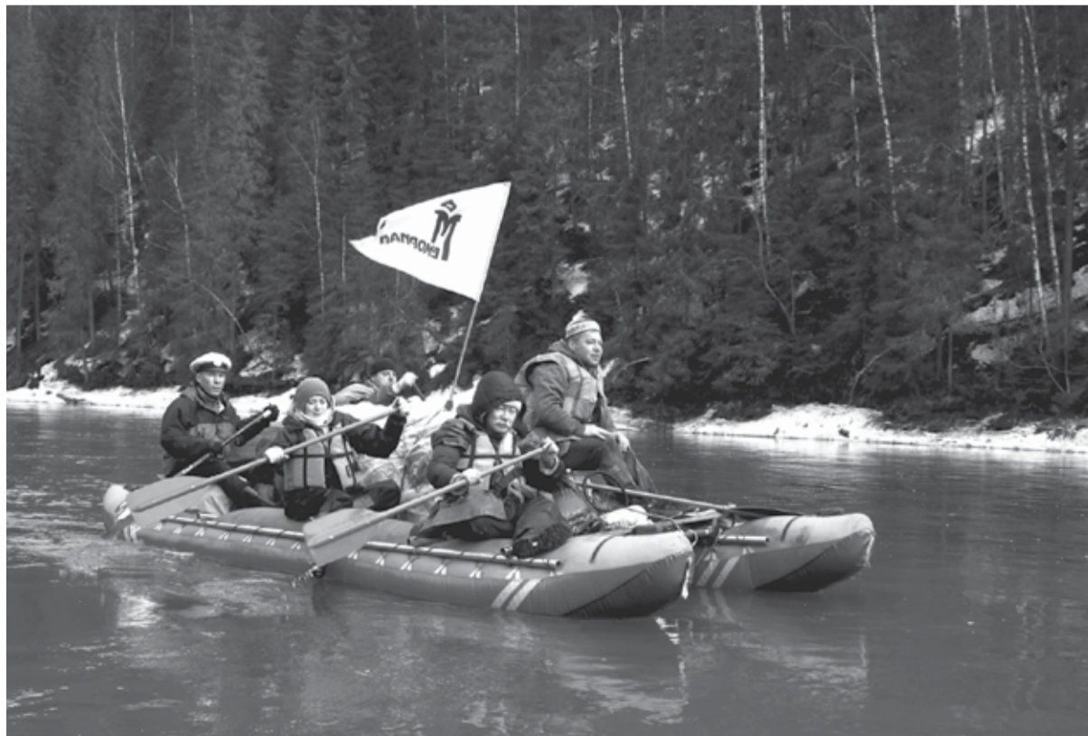
Во время экспедиции по реке Усьва. 3 мая 2018 года

Место проведения: Кунгурский и Кишертский районы Пермского края, река Сылва, сплав на катамаранах от села Усть-Кишерт до города Кунгура.