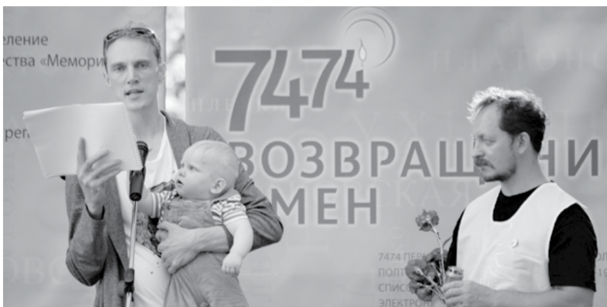
Акция «Возвращение имён»

На протяжении всего года Пермский «Мемориал» активно взаимодействовал с местной властью и государственными органами. Представители нашей организации активно работают в коллегиальных комиссиях и советах, в частности в краевой и городской комиссиях по восстановлению прав реабилитированных жертв политических репрессий, оргкомитете при правительстве Пермского края по проведению Дня памяти 30 октября и в краевой призывной комиссии.