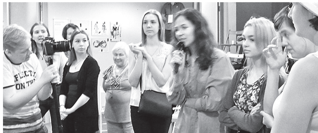
Пресс-конференция в городе Энск.

бунтовала молодёжь, шло строительство в сквере, были трудности у приюта для собак, детские сады предлагалось отдать бизнесмену, мэр захотел за чем-то построить фонтан, а бизнесмены — разбить транспортную сеть на небольшие отрезки с отдельной оплатой (вам это ничего не напоминает?) Во всём этом участникам предстояло жить и участвовать, вникать и разбираться.