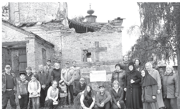
Волонтеры и местные жители у памятного знака в с. Кольчуг.