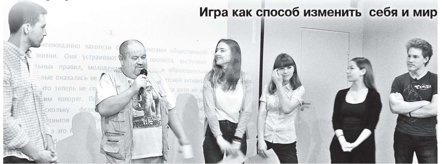
Споры на лобном месте

В придуманном городе мы прописали детали и проблематику, с которой предстояло работать: отсутствие скверов, парков и рекреационных зон, сложности с развитием транспортной сети, точечная застройка, нехватка мест в детских садах и школах, недостаток больниц и прочее. Параллельно ведущий игры вбрасывал различные сюжеты, которые случаются в городе и на которые жителям приходится реагировать вместе с решением текущих задач. В этот раз у нас