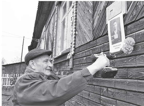
Память на фасаде дома.

В Осе и Мичуре появились мемориальные таблички «Последнего адреса»