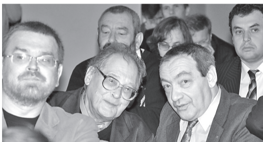
«Пилорама». Дискуссия в разгаре!

В декабре 1974 года Сергей Ковалёв был обвинён в антисоветской агитации и пропаганде. В декабре 1975 года суд в Вильносе приговорил его к семи годам лишения свободы и трём годам ссылки. На процесс приезжал Андрей Сахаров, физик, создатель водородной бомбы и диссидент. Срок Сергей Ковалёв отбывал в колонии строгого режима «Пермь-36». В 1980 году за участие в акциях лагерного сопротивления и «нарушения режима» переведён в Чистопольскую тюрьму. В ссылку был отправлен в Магаданскую область.