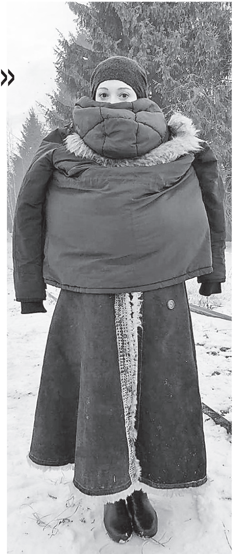
Чулпан Хаматова на съёмках сериала «Зулейха открывает глаза».

«Не на что было хоть что-то себе купить, нечему было радоваться. Есть у тебя плохое ситцевое платье, ты и рада... В деревне денег не было, мы никогда и не видали этих денег. На лесозаготовки отправят, зимой отправ-