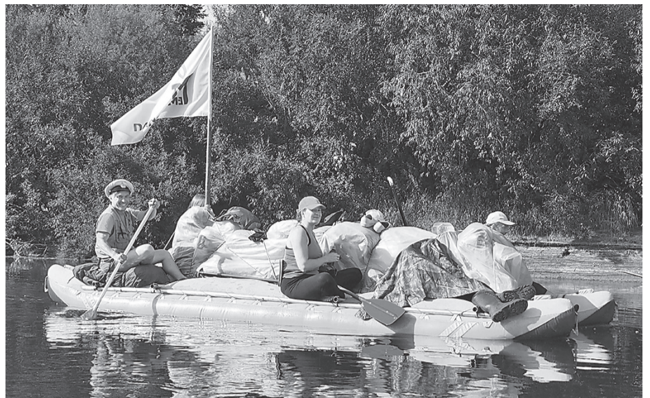
Команда волонтеров на реке Берёзовой.

Условия таёжной экспедиции, как вы понимаете, предполагают свои особенности. Жара или холод, мошкара, оводы... Если нам жарко, мы купаемся, если холодно - одеваемся теплее и греемся у костра, если вокруг тучи насекомых - надеваем плотную одежду. С нами всегда необходимые инструменты, спички, достаточно еды. Если мы устали, мы отдыхаем, если хотим двигаться дальше - грузимся на катамаран и идём по реке. А какие условия были у спецпоселенцев? Надзор и план выработки. План, который должен быть выполнен и в жару, и в холод: неважно, что ты голоден и одолевает мошкарой. Ты - «враг народа»,