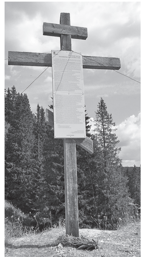
Поклонный крест с мемориальной табличкой в деревне Берёзово.