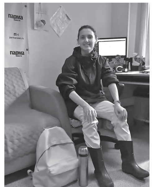
К экспедиции готова!