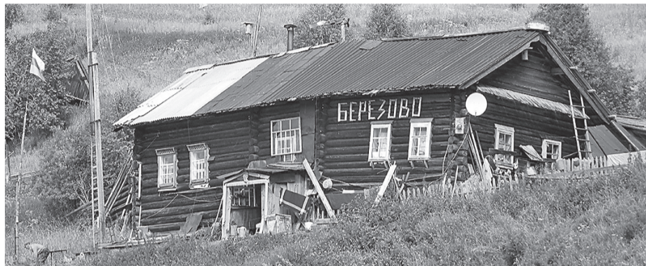
Дом Николая в деревне Берёзово.