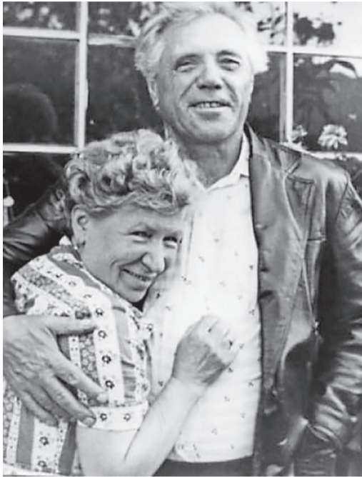
Вместе по жизни. Виктор Петрович и Мария Семёновна Астафьевы.