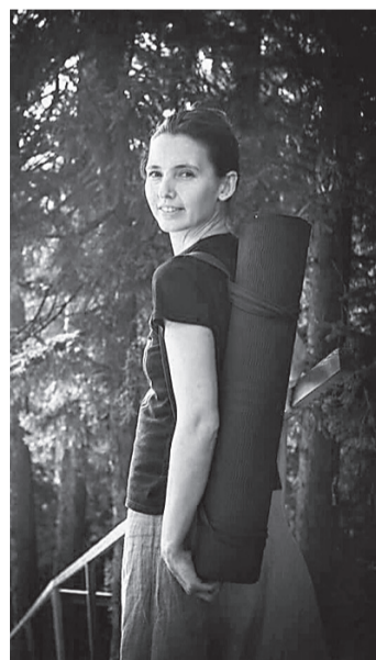
На йогу в сосновом лесу.