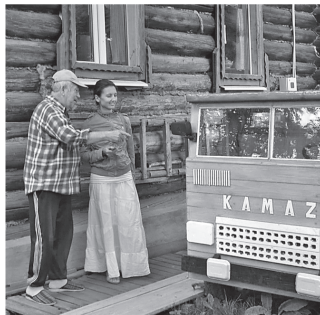
«Транспортное» интервью!

желательная организация», а эти - «иностранные агенты». Как на нас все ещё не повесили «жёлтую звезду»? Хотя, думаю, такое желание у людей, творящих беззаконие и не понимающих, что им за это вряд ли что-то будет, есть. Помню, на одном из судебных процессов сотрудник одной госструк-