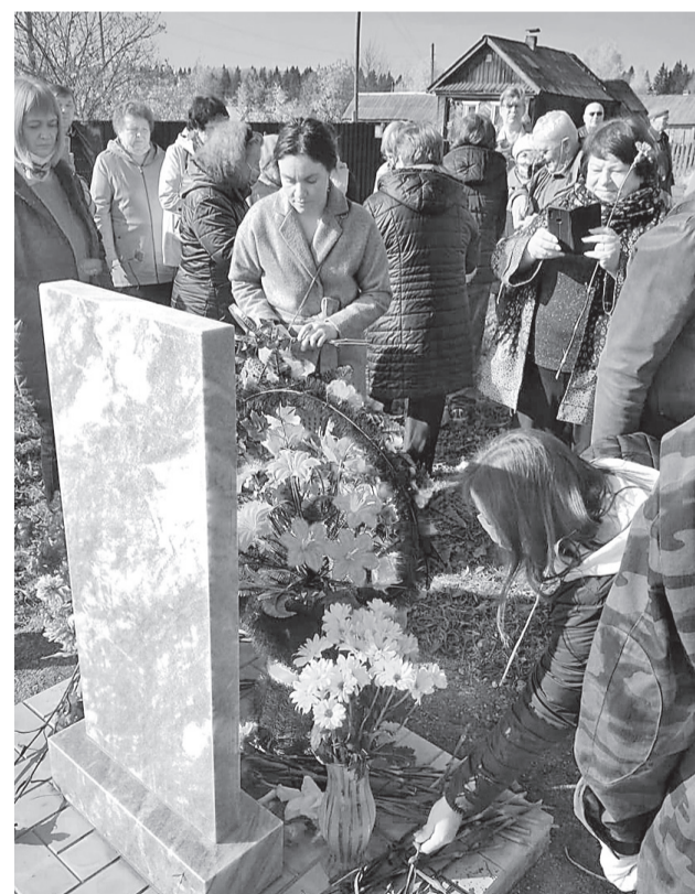
Возложение цветов к обелиску в посёлке Трактовый Добрянского района.

30 октября – День памяти жертв политических репрессий. Преступления, совершенные государством, коснулись, кажется, каждой семьи в нашем крае. Память о тех событиях – это ответственность и современного государства, и всех нас – граждан и по-