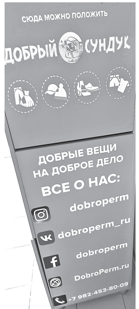
Вот как он выглядит, добрый сундук!

У проекта есть группа в соцсети «ВКонтакте» https://vk.com/ecotaxiperm и тел. 8-908-240-10-60. Зайдя на главную страницу группы, человек без труда сможет сделать за-