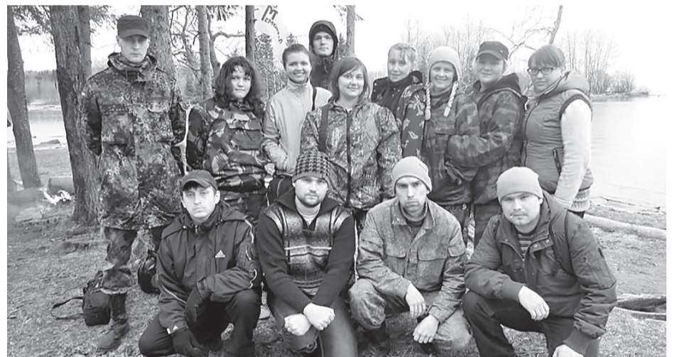
Команда волонтеров экспедиции «По рекам памяти», 30 марта 2014 года.