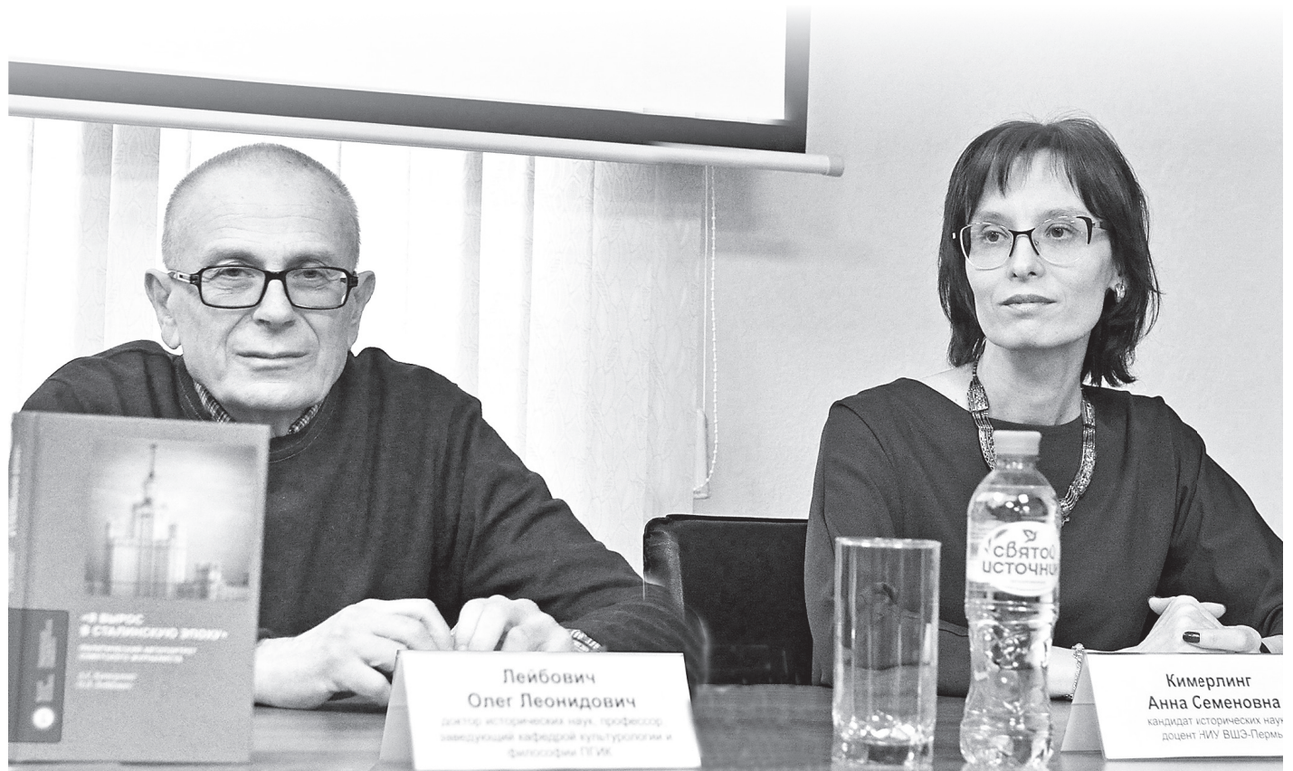
Авторы книги на её презентации в Пермском государственном архиве социально-политической истории.