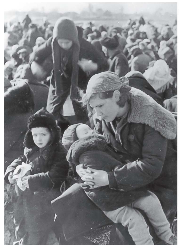
г. Лубны, Украина. Мать с двумя детьми на сборном пункте вместе с другими евреями города ожидают казни, 16 октября 1941 г.

столицы юмора по-прежнему жива. Миф пережил реальность. Хотя одесситы стараются. Проводят знаменитые юморинки, но, говорят, это уже не тот юмор. Разъехались по свету известные в недавнем прошлом музыканты, писатели, художники, где-то вдалеке ищут счастья члены прославленной на весь СССР команды КВН, знаменитые «Одесские джентльмены». И вообще сегодня евреи не заметны, их осталось около 30-ти тысяч, всего три процента населения Одессы. А ведь ни для кого не секрет – именно они