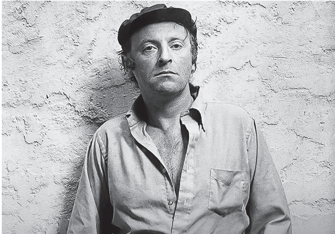
Иосиф Бродский. 1960-й год.

В них как бы заложена отрицательная генетическая память. Как и их предшественники, «идейные» борцы против врагов народа, они легко нащупывают изнанку любой политической системы. И ловко используют её. А если систему отличают закрытость, если она лишь имитирует демократию, если процветают всеобщая озлобленность, доносы, страх перед КГБ-ФСБ, то будьте уверены, Лернеры уже при деле. Всегда на посту. В любые времена.