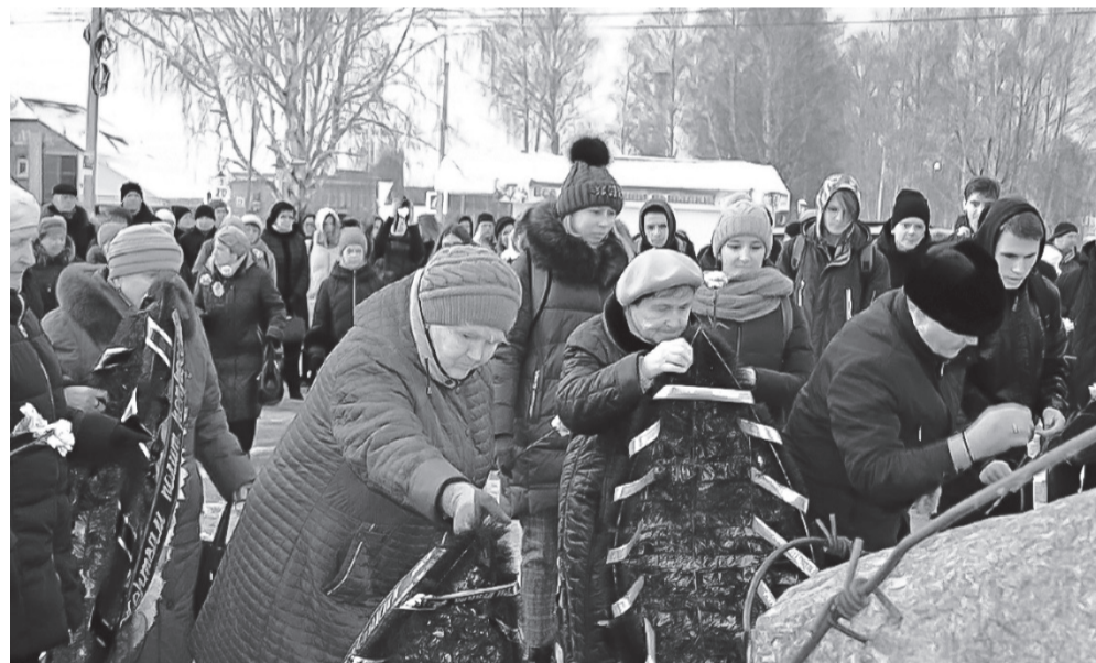
У Камня плача и слёз.