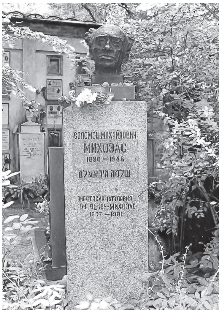
Могила Соломона Михоэлса, первого председателя Еврейского антифашистского комитета. Москва. Новое Донское кладбище.