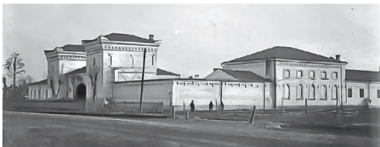
Тюрьма НКВД №2, в здании которой сейчас располагается Пермский Театр кукол.

ря. Напомним, что Вишерлаг был самым первым крупным лагерным управлением в СССР и действовал с 1928-го по 1934-й годы, ещё до официального учреждения Главного управления лагерей (ГУЛАГ) НКВД. В 1931-м году максимальная численность заключённых Вишерлага составляла 39 тысяч человек. Они строили Красновишерский целлюлозно-бумажный комбинат, Березниковский химический завод и другие предприятия на севере региона. Тяжелейшие условия труда и быта predeterminedели и самую высокую смертность среди всех других лагерных управлений того периода – по официальной статистике здесь погибал каждый третий заключённый.